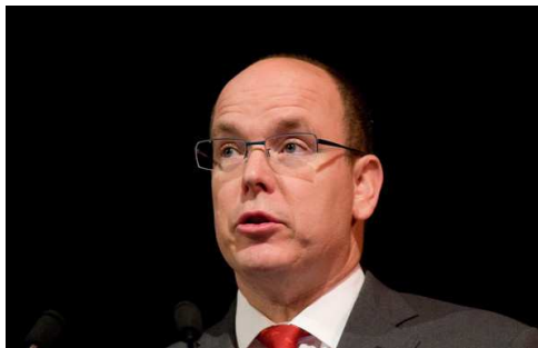
SAS le Prince Albert II

En 2005, lors de son discours d'avènement, SAS le Prince Albert II de Monaco a déclaré son engagement profond pour la préservation de l'environnement.