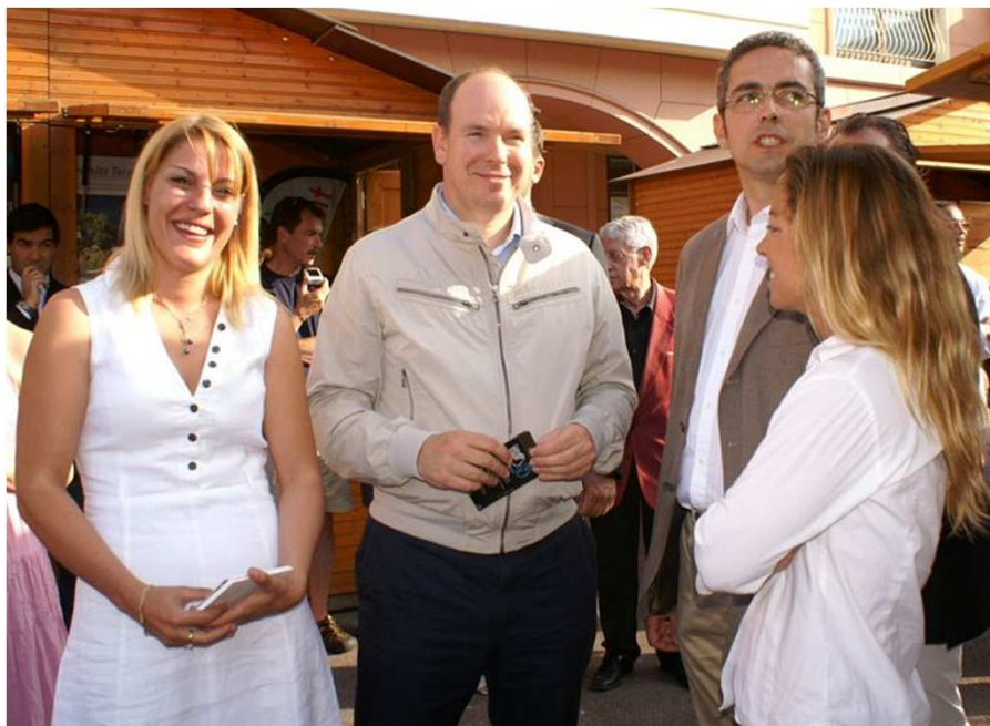
ft.©WSM/Colman - Inauguration Monacology 2011, stand de l'IMEDD, de la SMEG et de 4MYPLANET