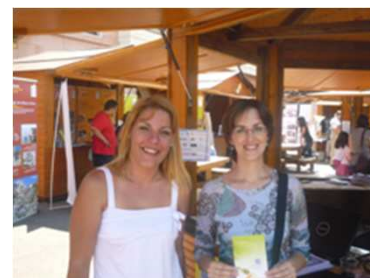
IMEDD ET RADIO ETHIC