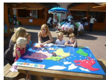
ANIMATION DE BIO LOGIKA ET LES ENERGIES SMEG, IMEDD ET LES ENFANTS