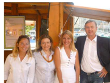
4MYPLANET, MONTECARLOIN, IMEDD, SMEG